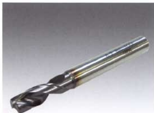
高硬度スポットカッター 「スーパーカッター SP802」(別売り)