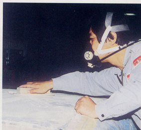
▲サンディング作業